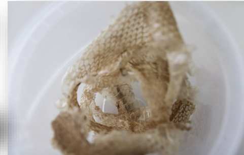
D. Marcos A. González González Muda de Malpolon monspessulanus , eiruga de Acheronthis atropos , niño de vespa alfareira ( Eumeninae ) e caixa entomolóxica con Sesia apiformis