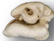
D. Manuel Peón Fernández Ósos do oído externo dun exemplar adulto de toniña ( Phocoena phocoena )