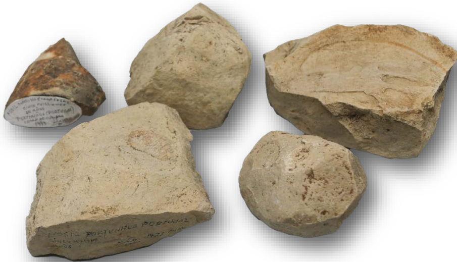
D. Manuel Xío Blanco 5 fósiles (Portunhos, Portugal)