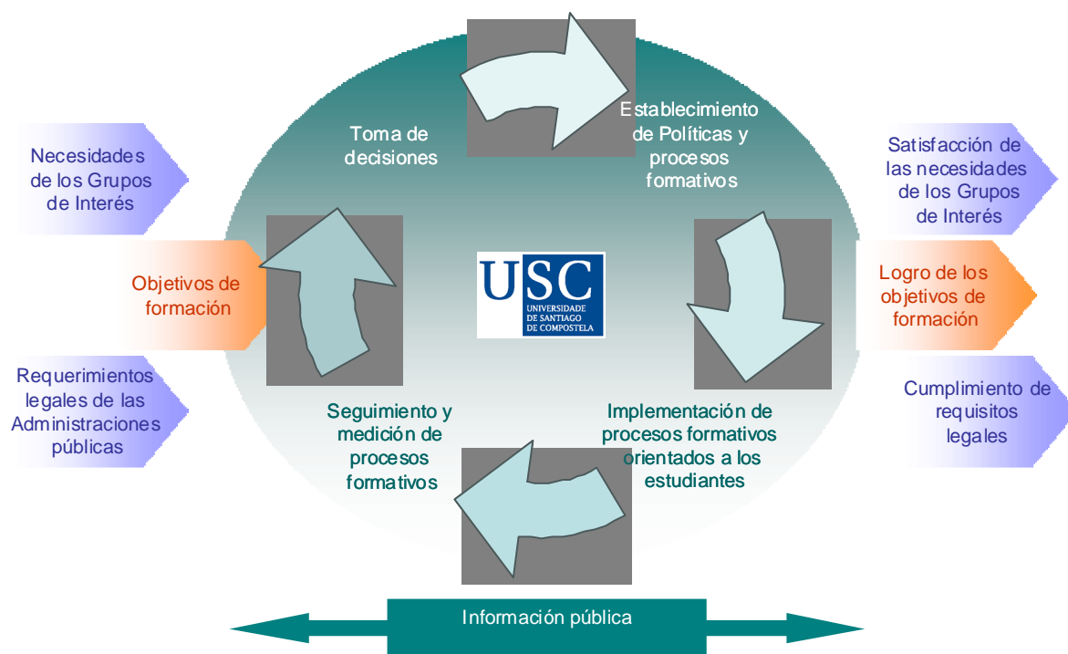
Figura 2. Garantía de calidad en la USC

estratégica se fija la política de calidad, se establecen los objetivos y se desarrolla el SGIC, que establecerá todo el despliegue de la política mediante la implantación de una gestión por procesos. Se procede a la medición y análisis de los resultados obtenidos, a realizar los ajustes necesarios y a contrastarlo con los grupos de interés que serán quienes determinen si el ciclo de garantía de calidad es el más adecuado para la USC (ver figura 2).