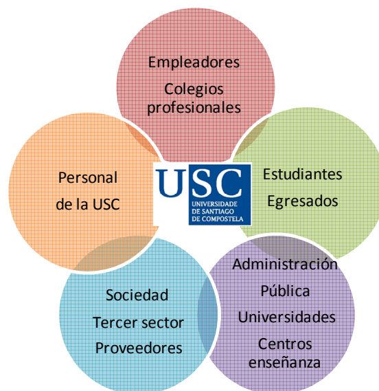
Figura 1. Grupos de interés de la USC

En la figura 1 se incluye, a título ilustrativo, la identificación de los principales grupos de interés: