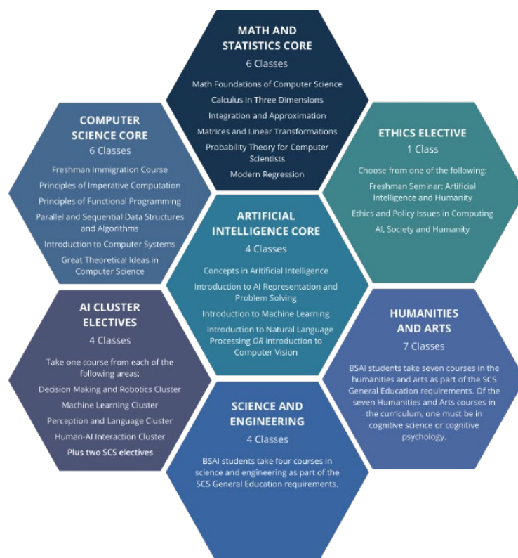
Figura 1. Estructura del B.Sc. in AI (Carnegie-Mellon University) 45 .

Este enfoque amplio, centrado en la resolución de muy diferentes tipos de problemas, y no únicamente con un planteamiento tecnológico se ve refrendado en el mismo ACM-IEEE CC2020 cuando se refiere a las capacidades de la Inteligencia Artificial para abordar problemas sociales y organizacionales complejos, bajo la etiqueta "Tecnologías Cognitivas." La consultora Deloitte, incluye en esta categoría 46 paradigmas como la automatización y robotización de procesos, el procesamiento del lenguaje natural, el aprendizaje automático o la visión por computador. Accenture las encuadra dentro de lo que denomina las tecnologías DARQ ( D istributed ledger technology, A rtificial intelligence, extended R eality and Q uantum computing) 47 que, en su visión serán empleadas por las organizaciones que quieran diferenciar sus productos o servicios. También el Gartner Hype Cycle 48 describe en