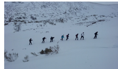
Ascendendo ao cumio do Mustallar (13 de marzo de 2018)

O máster ten carácter académico profesional pero é un título que facilita o acceso ao Doutoramento en Educación da USC. Cabe tamén salientar que este título ten a súa propia dinámica investigadora e que os estudantes poden integrarse en equipos xa constituídos para a realización de teses. Este máster mantén un programa de intercambio Erasmus coa Philippis-Universität de Marburg (Alemaña) e programas de cooperación coa Universidade de Cumbria (Reino Unido).