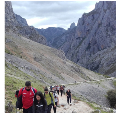
Facendo o sendeiro do Cares (Picos de Europa) con estudantes da Universidade de Cumbria (13 de maio de 2018)

Características do curso: É un máster oficial que reúne as temáticas de educación ao aire libre, educación ambiental, literatura e arte en relación coa natureza, deseño e organización de itinerarios e excursións, arquitectura rural e paisaxe, deporte, exercitando aos estudantes no desenvolvemento de capacidades para a xestión, organización e dirección de grupos e institucións en relación co medio natural.