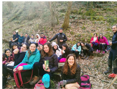
Na ruta do Gallol na Fonsagrada (23 de febreiro de 2018)

Preinscrición: Adxudicación de prazas: Matriculación: Arredor do Matriculación (lista de agarda): Circa Prazo matriculación vacantes: setembro Comezo do curso: 24 de setembro de 2018. Remate da fase teórica: 21 de marzo de 2019. Prácticum: 25 de marzo ao 27 de maio de 2019. Presentación deTFMs: 27 a 29 de xuño de 2019.