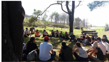
Parque das Dunas de Corrubedo . (3 de outubro de 2017)

Características dos estudantes aos que vai dirixido o curso: É un máster oficial especialmente deseñado para graduados ou diplomados nos distintos títulos de educación (Mestre, Educación Social, Pedagogía, Psicopedagogía), e tamén moi adecuado para licenciados/graduados en Bioloxía, Xeoloxía, Xeografía ou Ciencias da Actividade Física e Deporte, así como para outros títulos relacionados cos contornos naturais como as titulacións agroforestais . A pesar de que ningún título está excluído, para iniciar estes estudos, como perfil de ingreso, é recomendable ter algunha experiencia en asociacionismo xuvenil, campismo, coñecemento da natureza, deportes de montaña, excursionismo, capacidade narrativa e de descrición de paisaxes, nocións de seguridade en actividades ao aire libre, habilidades para o traballo cooperativo, optimismo, boa forma física e coñecemento de idiomas. Como tal máster oficial o título é válido en todos os países da Unión Europea.