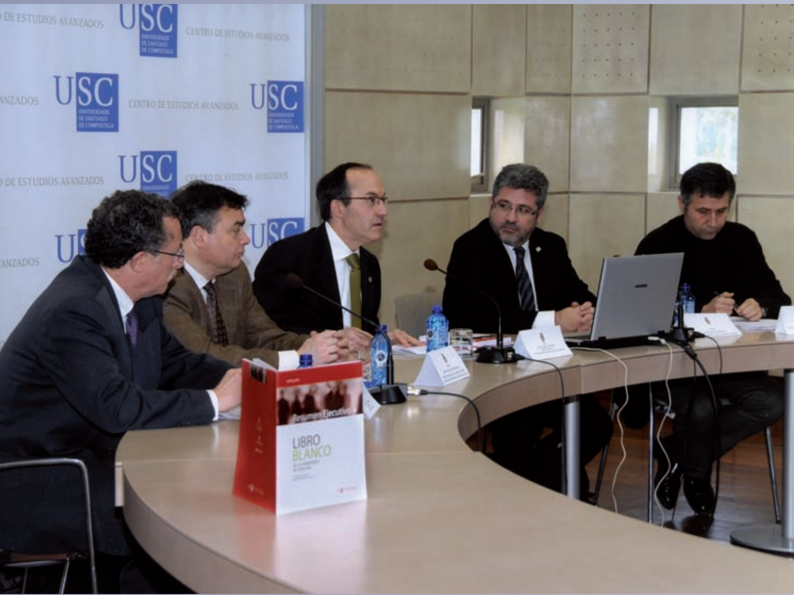
Presentación Libro Blanco. USC