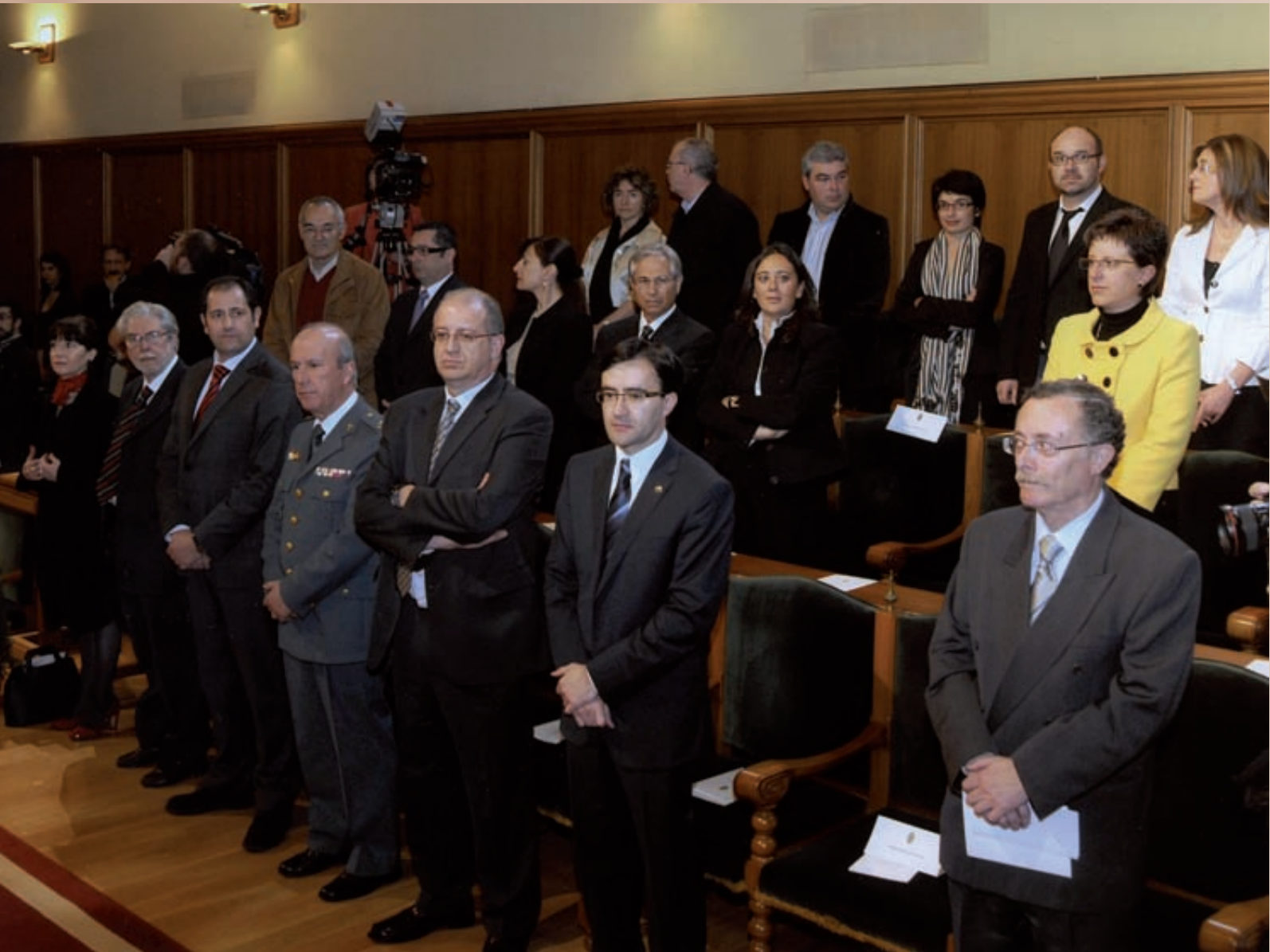
Apertura Curso USC 2009