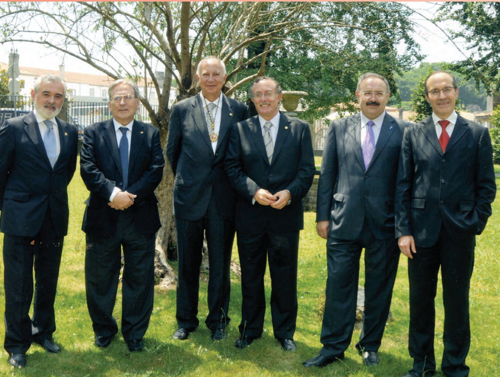
Apertura do curso académico · 13 de setembro 2010