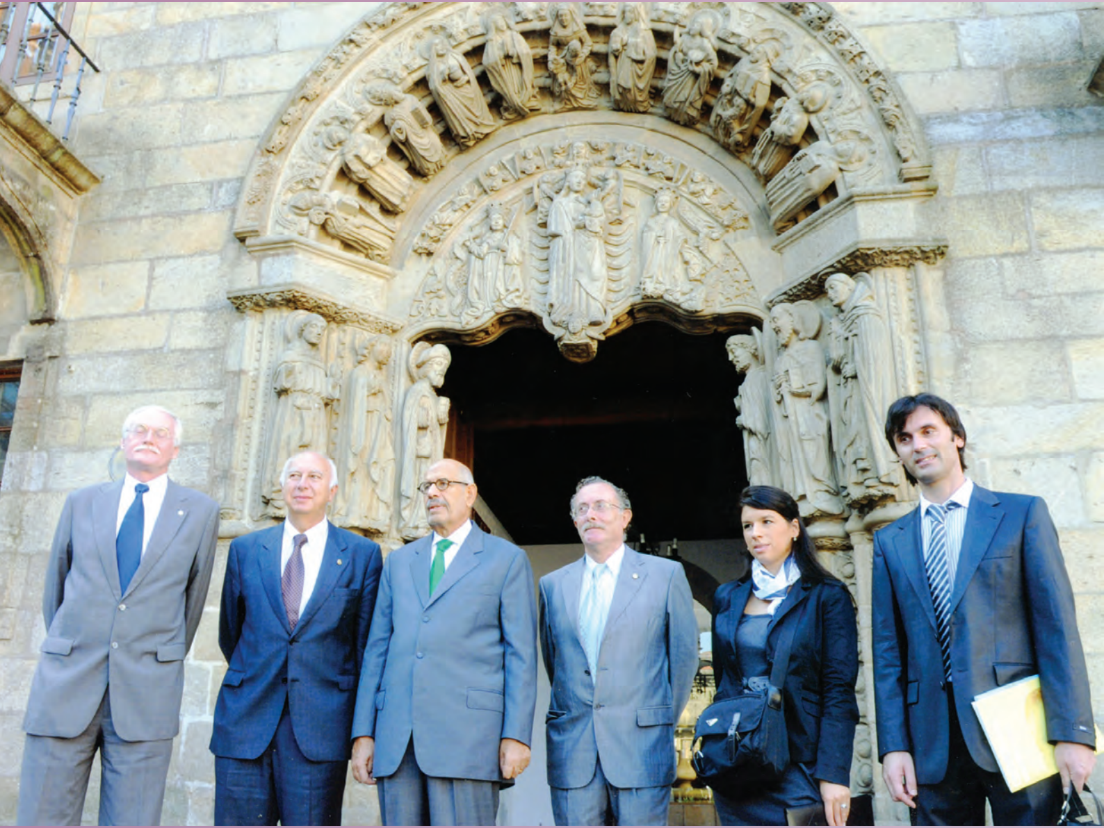
Recepción do Premio Nobel Dr. Mohamed El Baradei · 20 de setembro de 2010