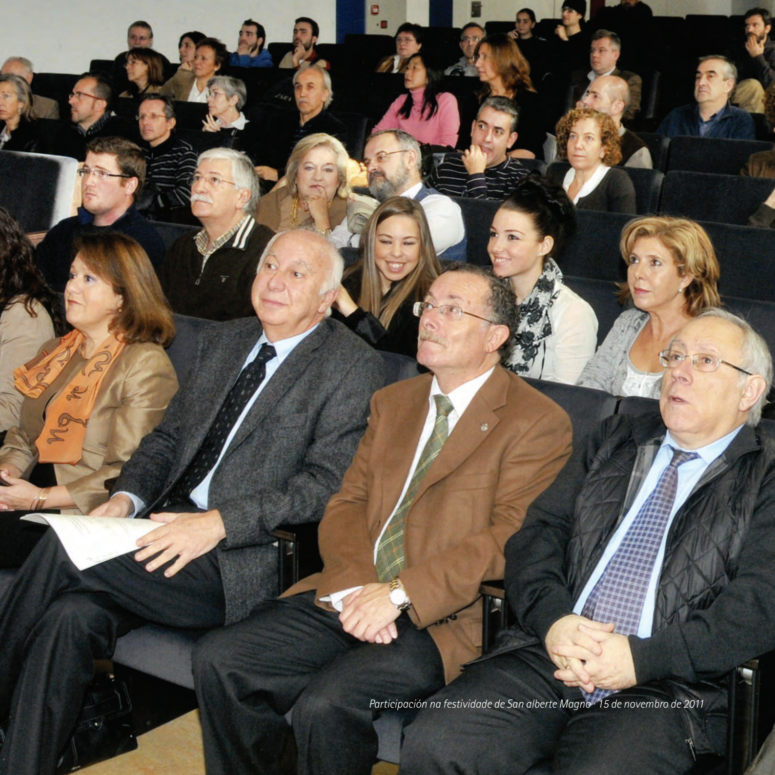
Participación na festividade de San alberte Magno · 15 de novembro de 2011