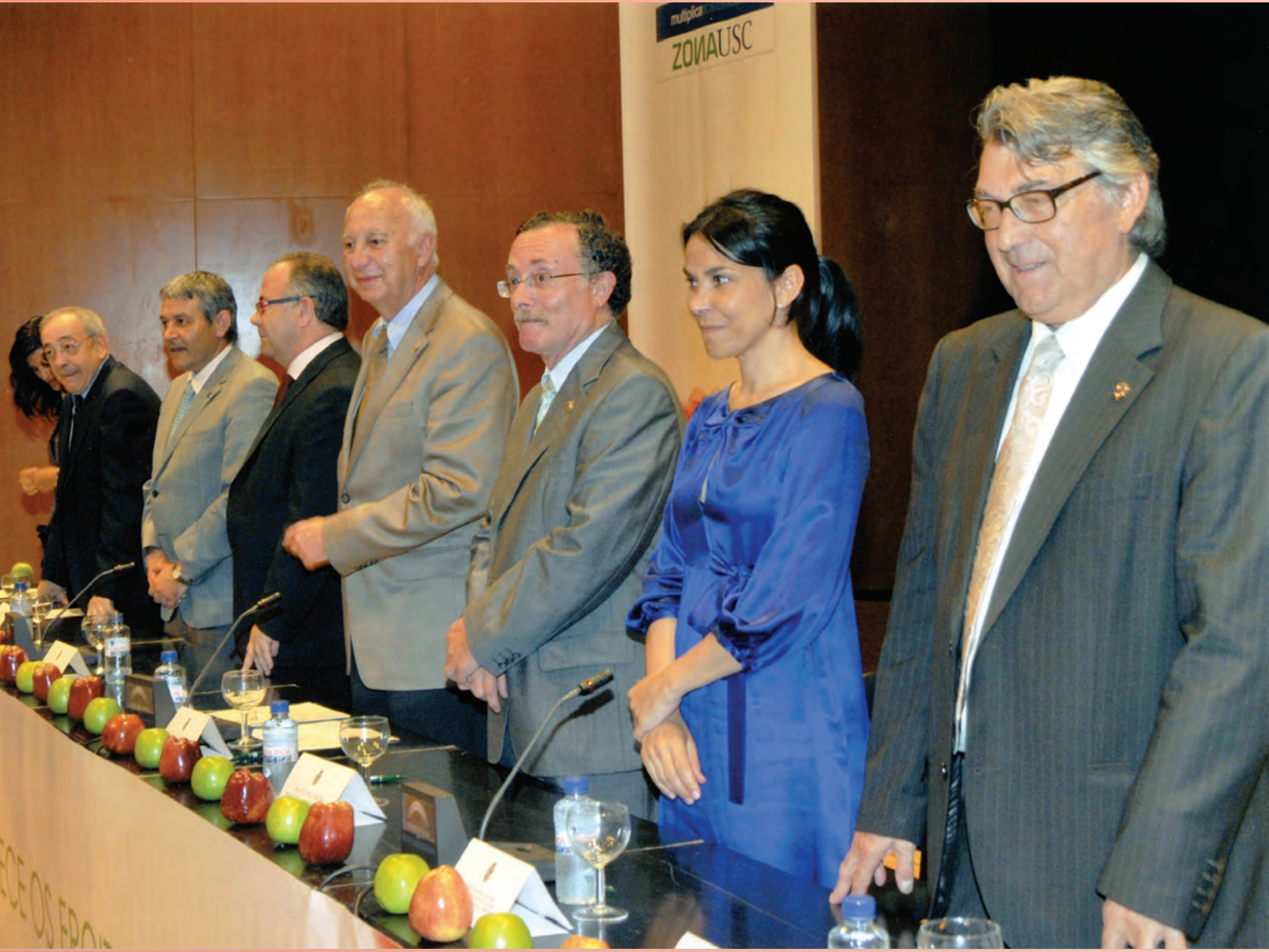
Participación no acto de recoñecemento dos mellores estudantes de ensino medio na selectividade · 9 de xullo de 2010