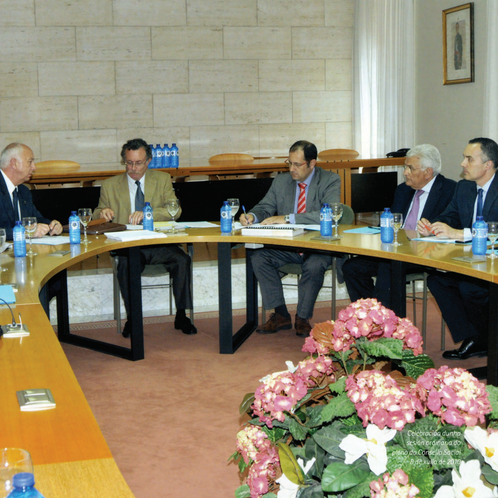
Celebración dunha sesión ordinaria do pleno do Consello Social 8 de xullo de 2010