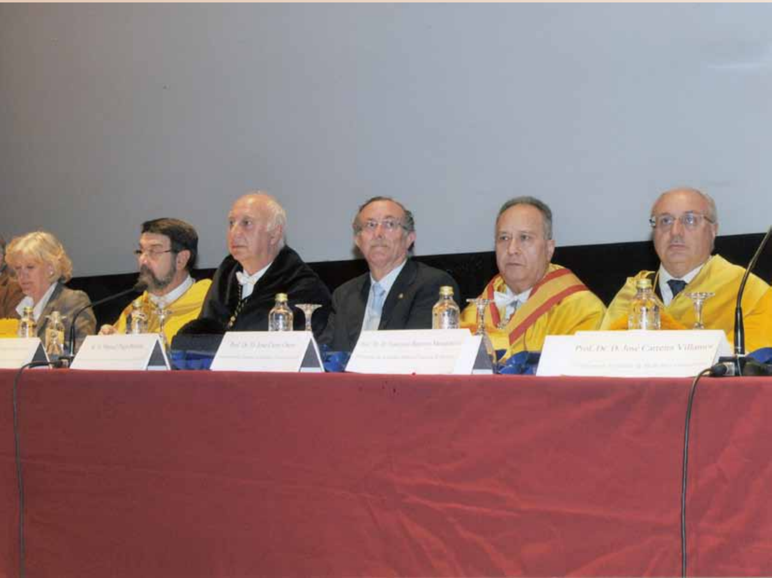
Acto graduación Medicina. 13 de abril de 2011