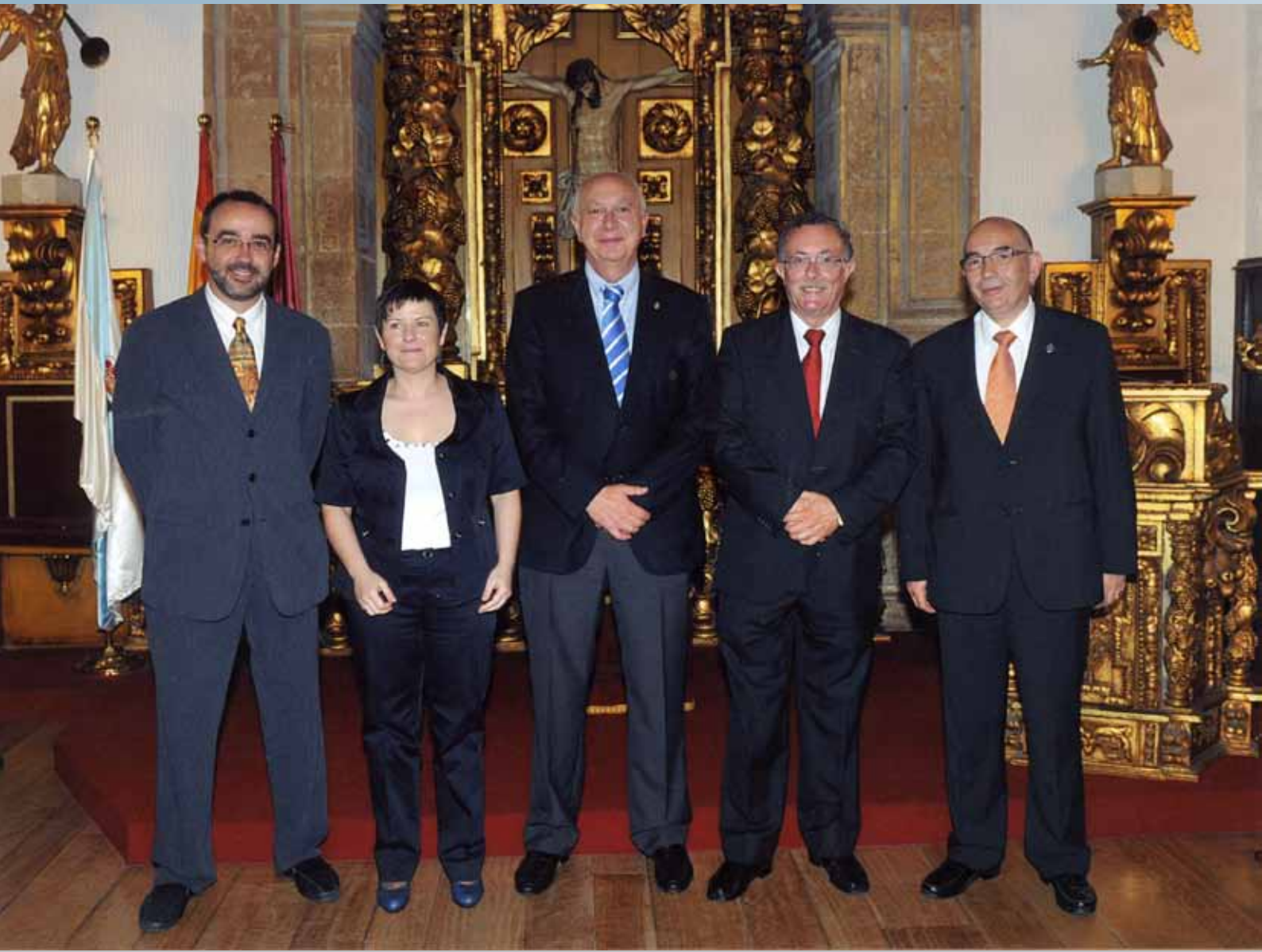
Toma de posesión do novo equipo de goberno. 28 de xullo de 2011