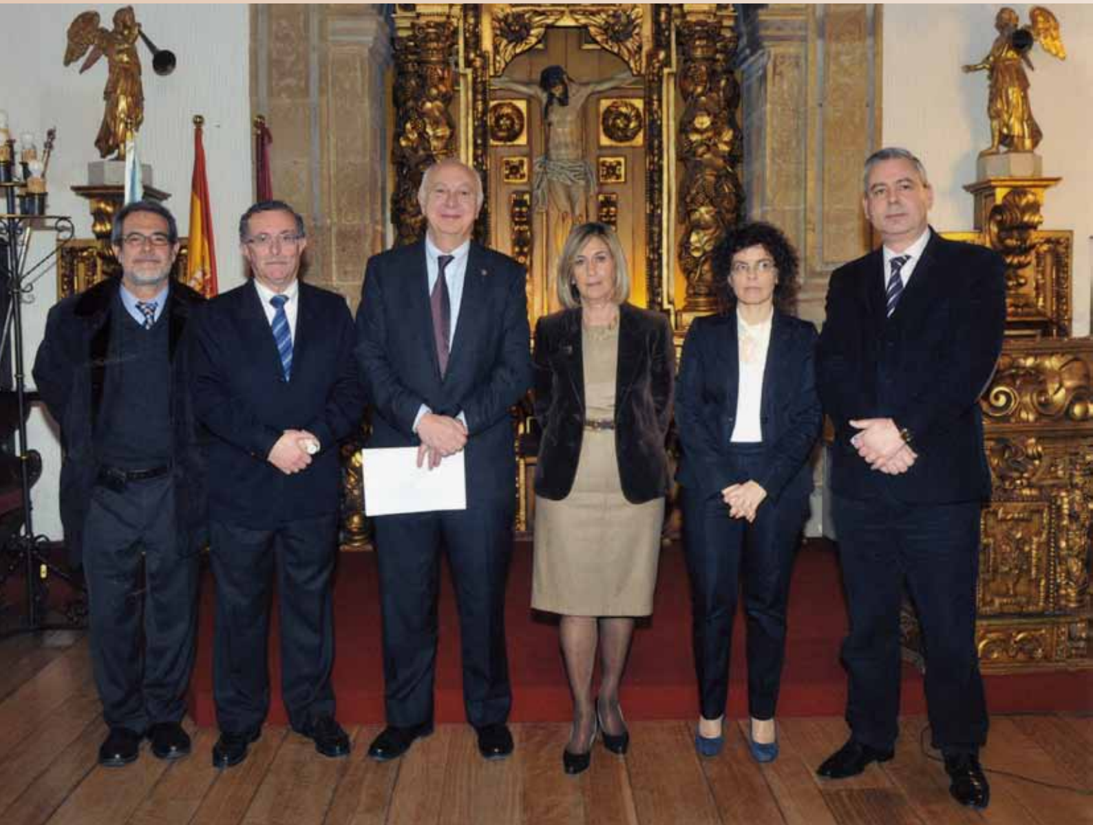
Toma de posesión da Decana de Farmacia - 3 de marzo de 2011