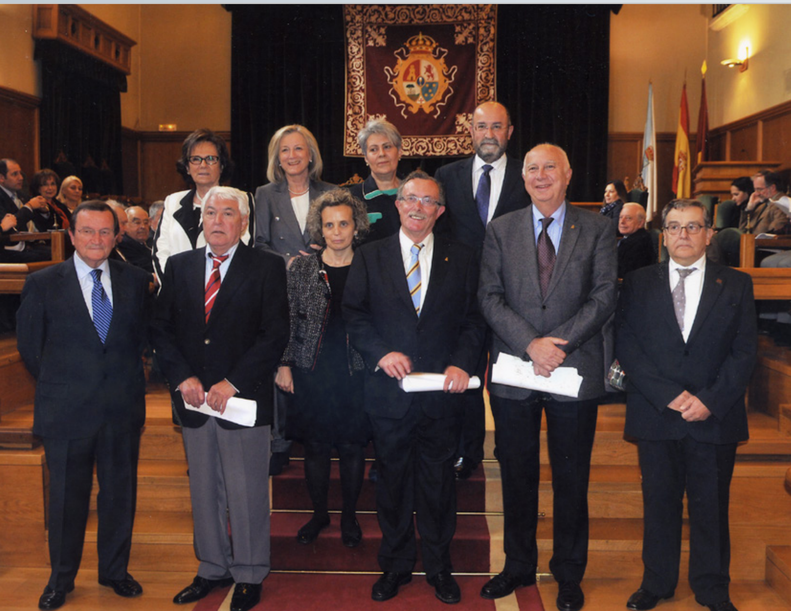
XVIII Asamblea Xeral Ordinaria da Asociación de Antigos Alumnos e Amigos da USC