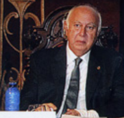
D. ALBERTO NÚÑEZ FEIJÓO PRESIDENTE BUNTA GALICIA