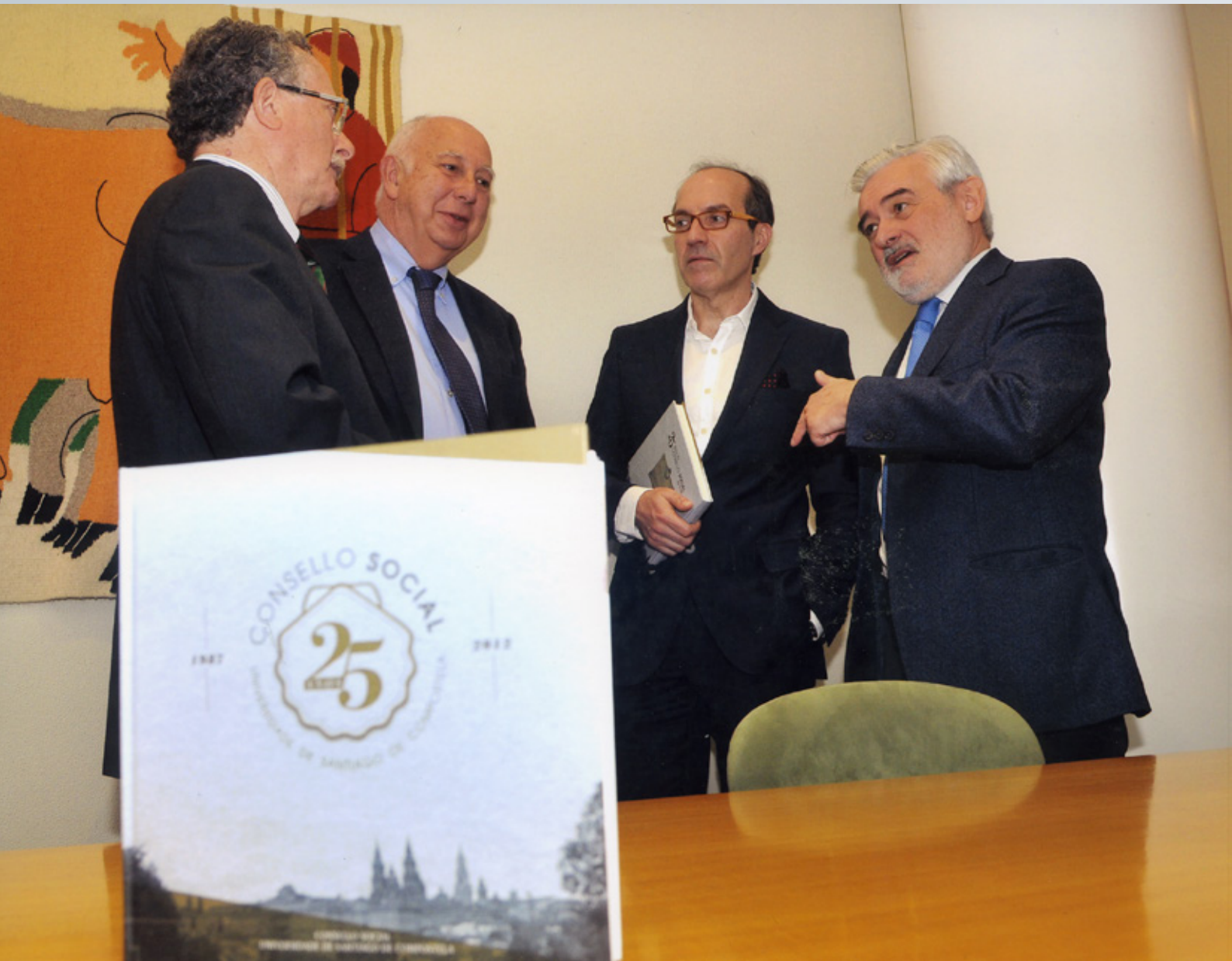
Acto de Presentación do Libro do 25 Aniversario do Consello Social