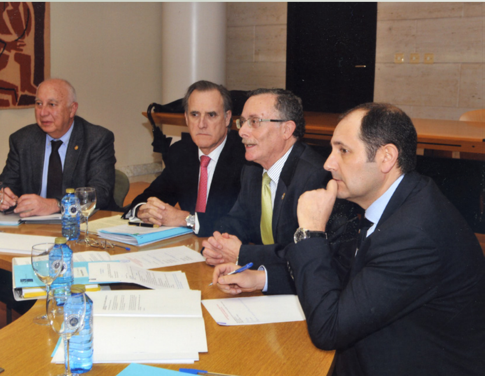
Celebración dun pleno. Febreiro 2014