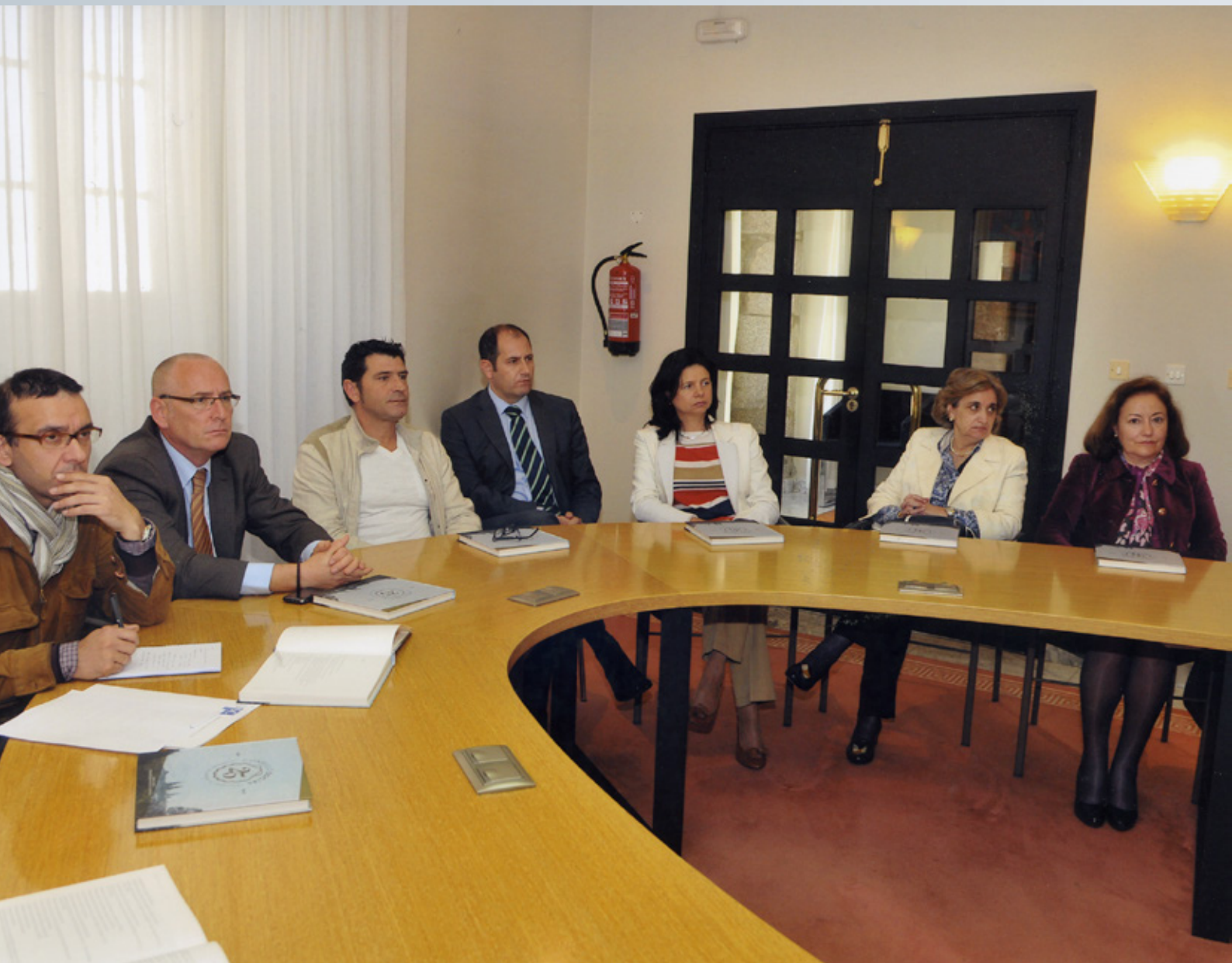
Acto de Presentación do Libro do 25 Aniversario do Consello Social