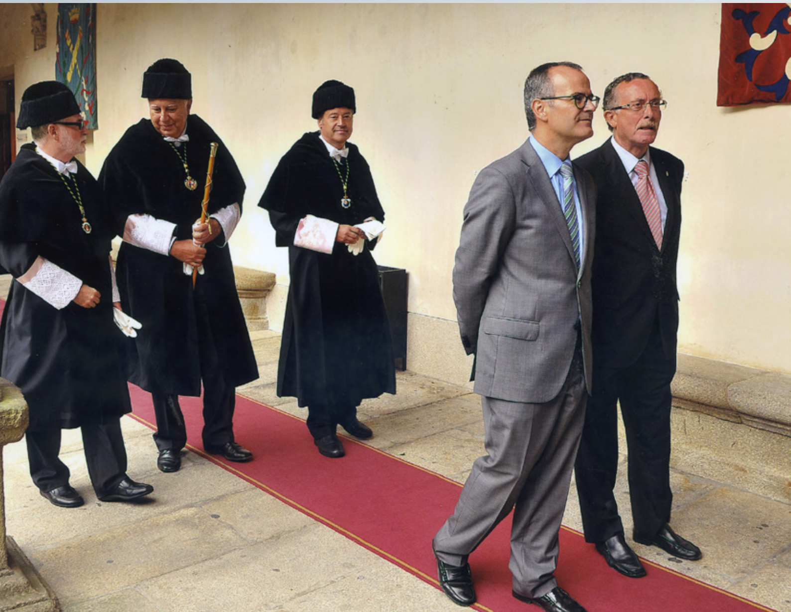
Apertura de Curso 2013-2014 del SUG