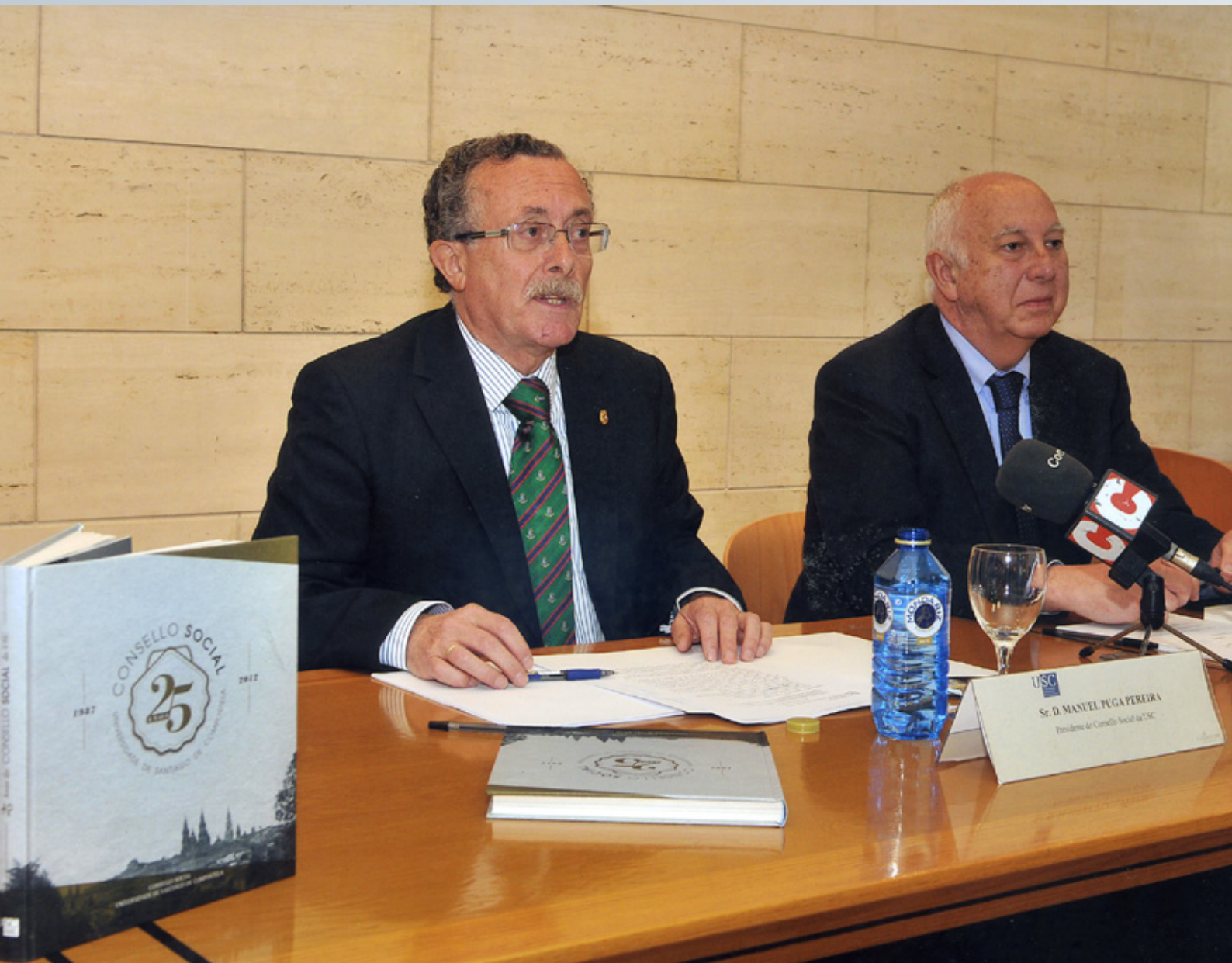
Acto de Presentación do Libro do 25 aniversario do Consello Social