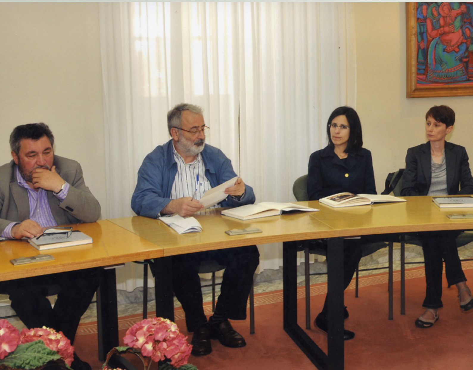
Acto de Presentación do Libro do 25 Aniversario do Consello Social