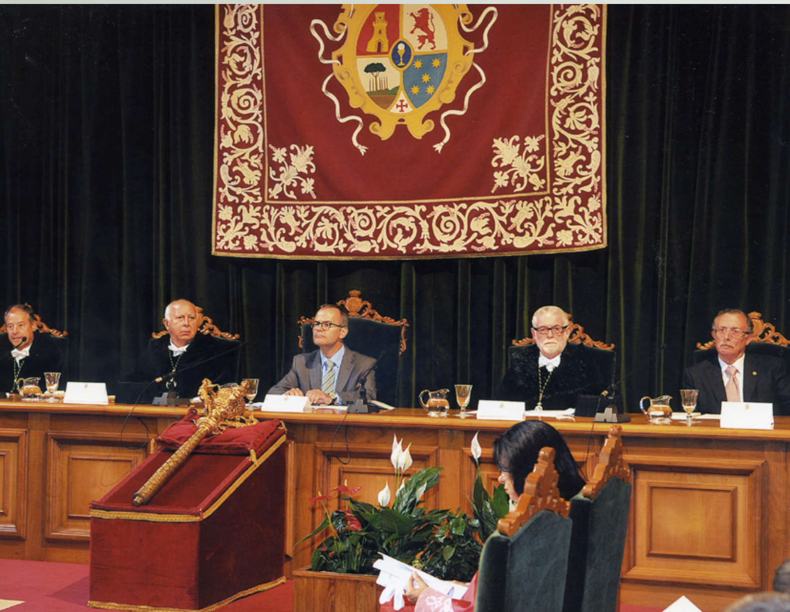
Apertura de Curso 2013-2014 del SUG