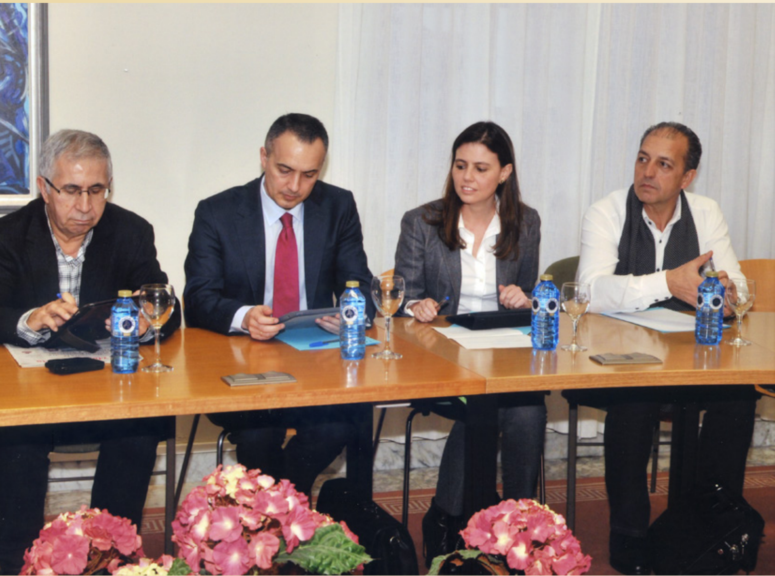
Celebración dun pleno