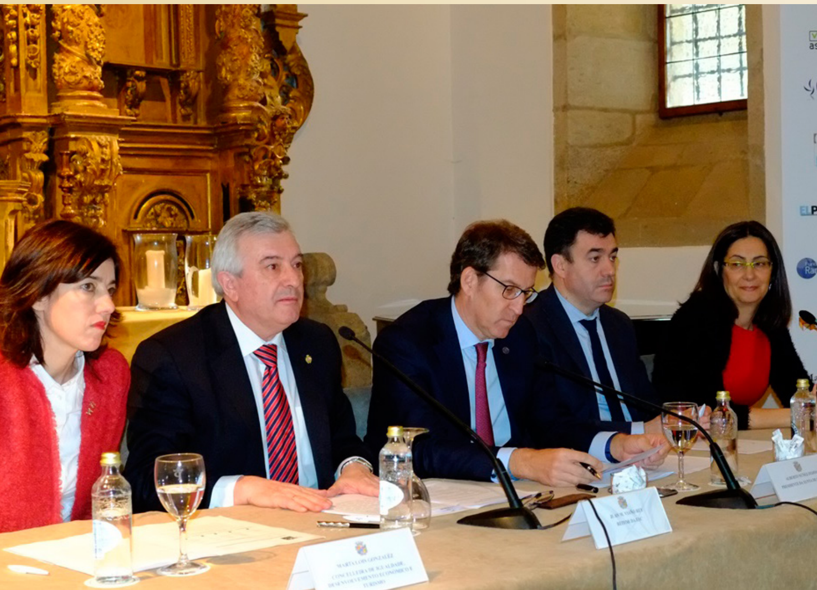
Presentación do Proxecto Mentoring USC