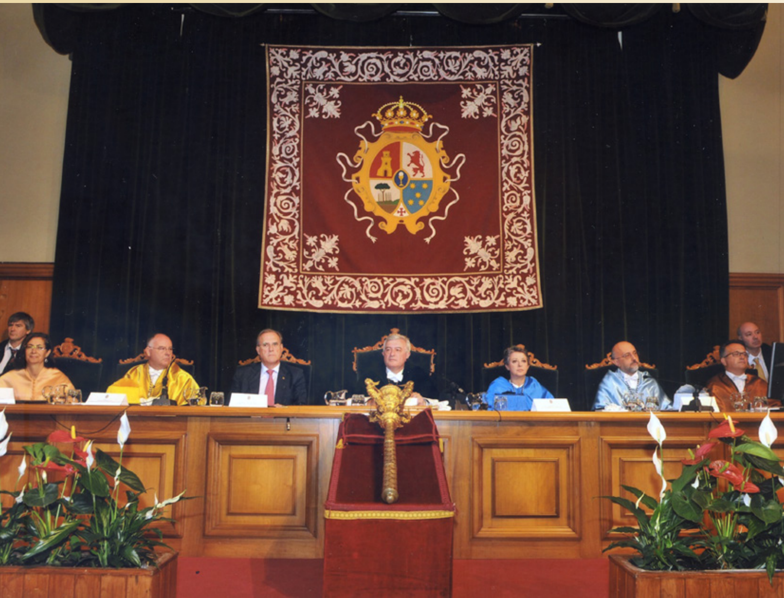
Inauguración Curso Académico 2015-2016 (11 setembro de 2015)