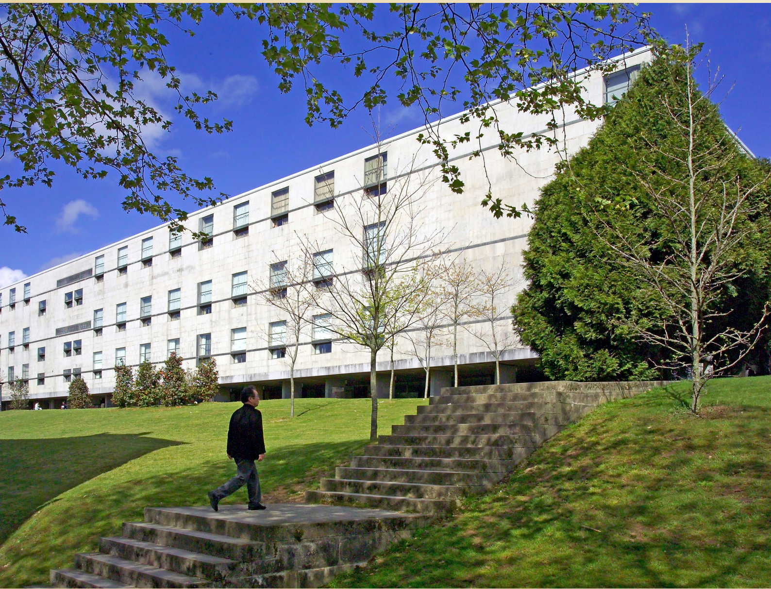
Facultade de Filoxía