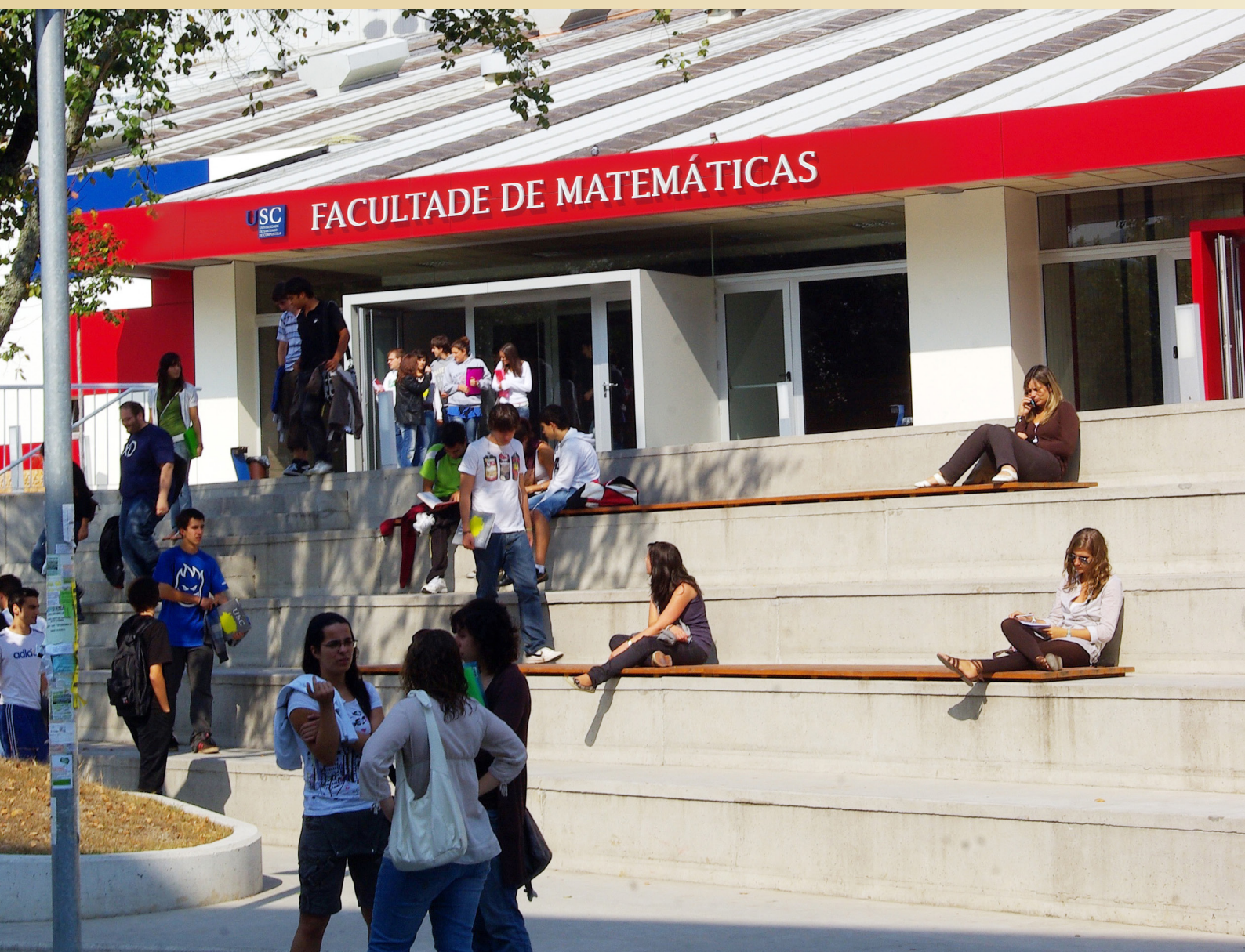
Faculdade de Matemáticas