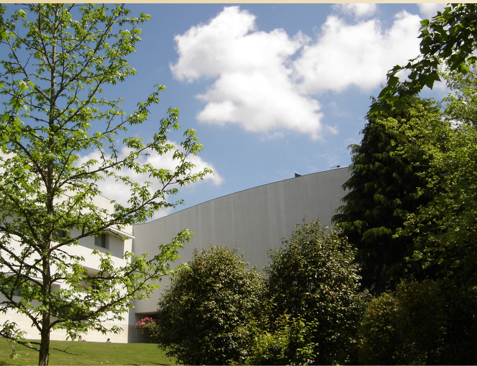
Faculdade de Jornalismo