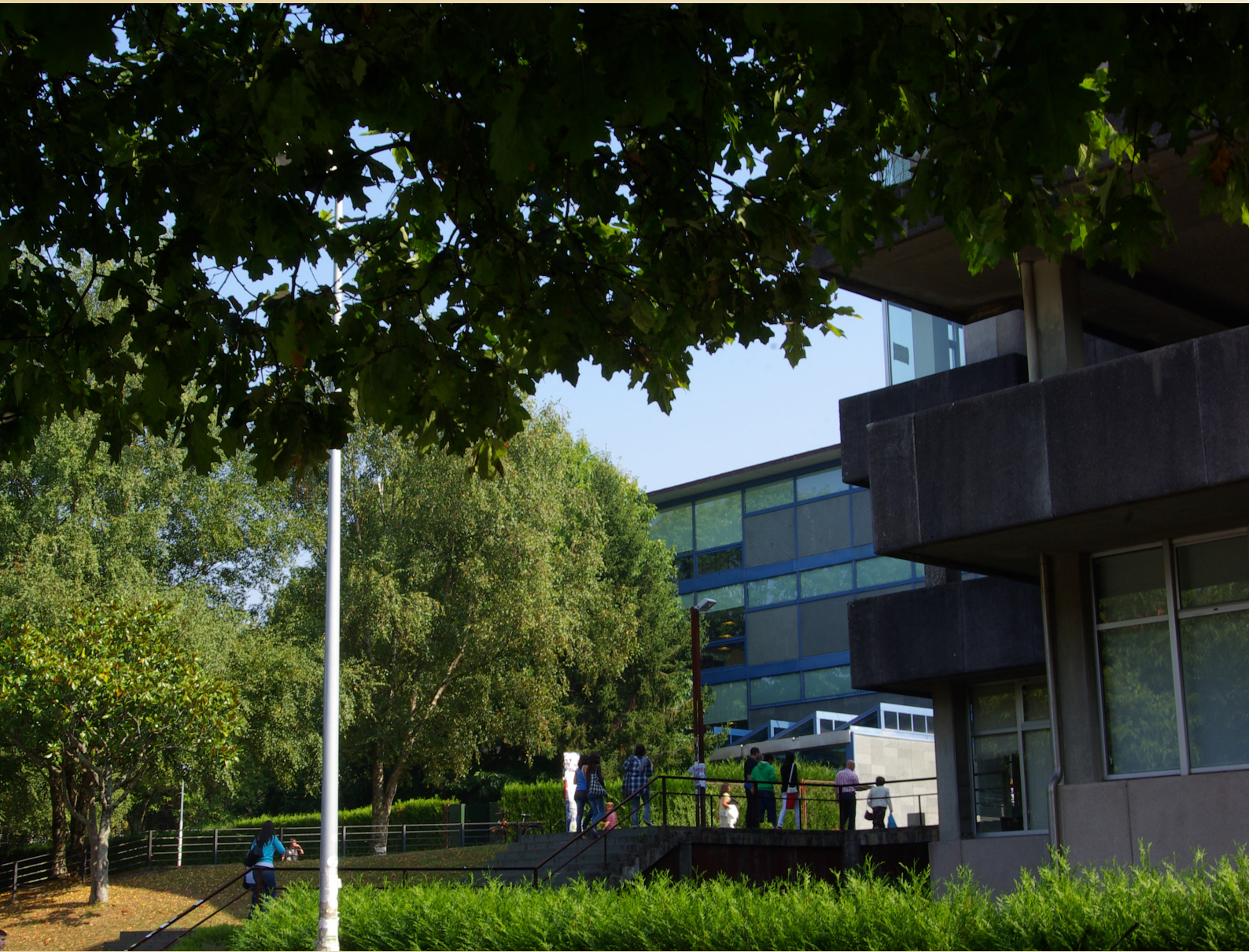
Biblioteca Concepción Arenal