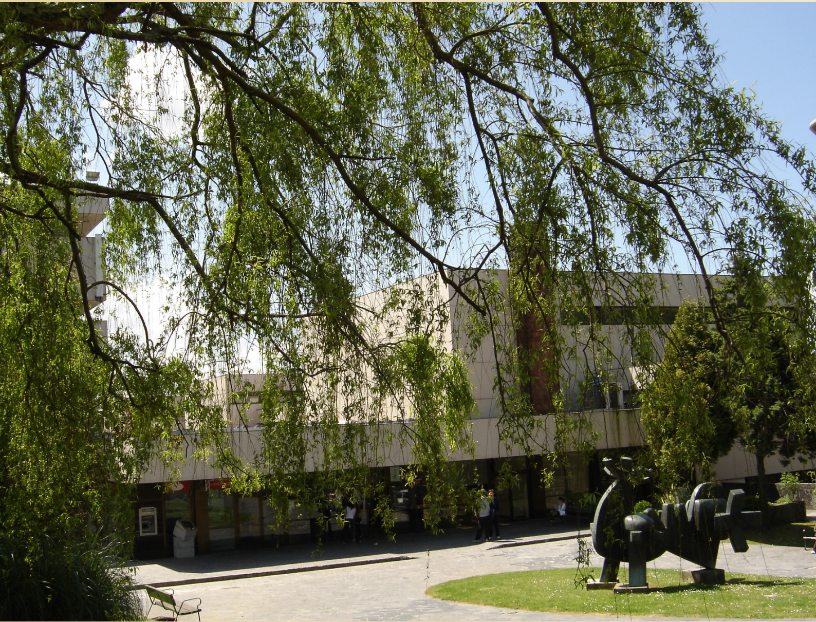
Facultade de Económicas