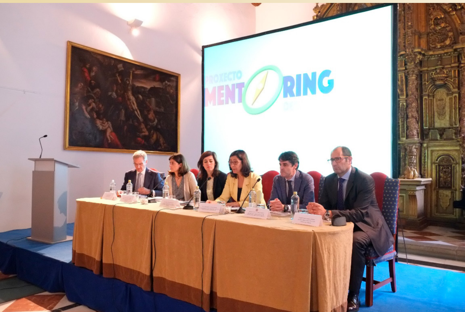
Clausura do Proxecto Mentoring