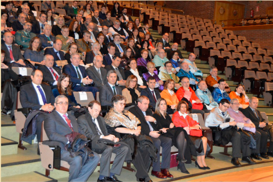
Celebración de San Tomé