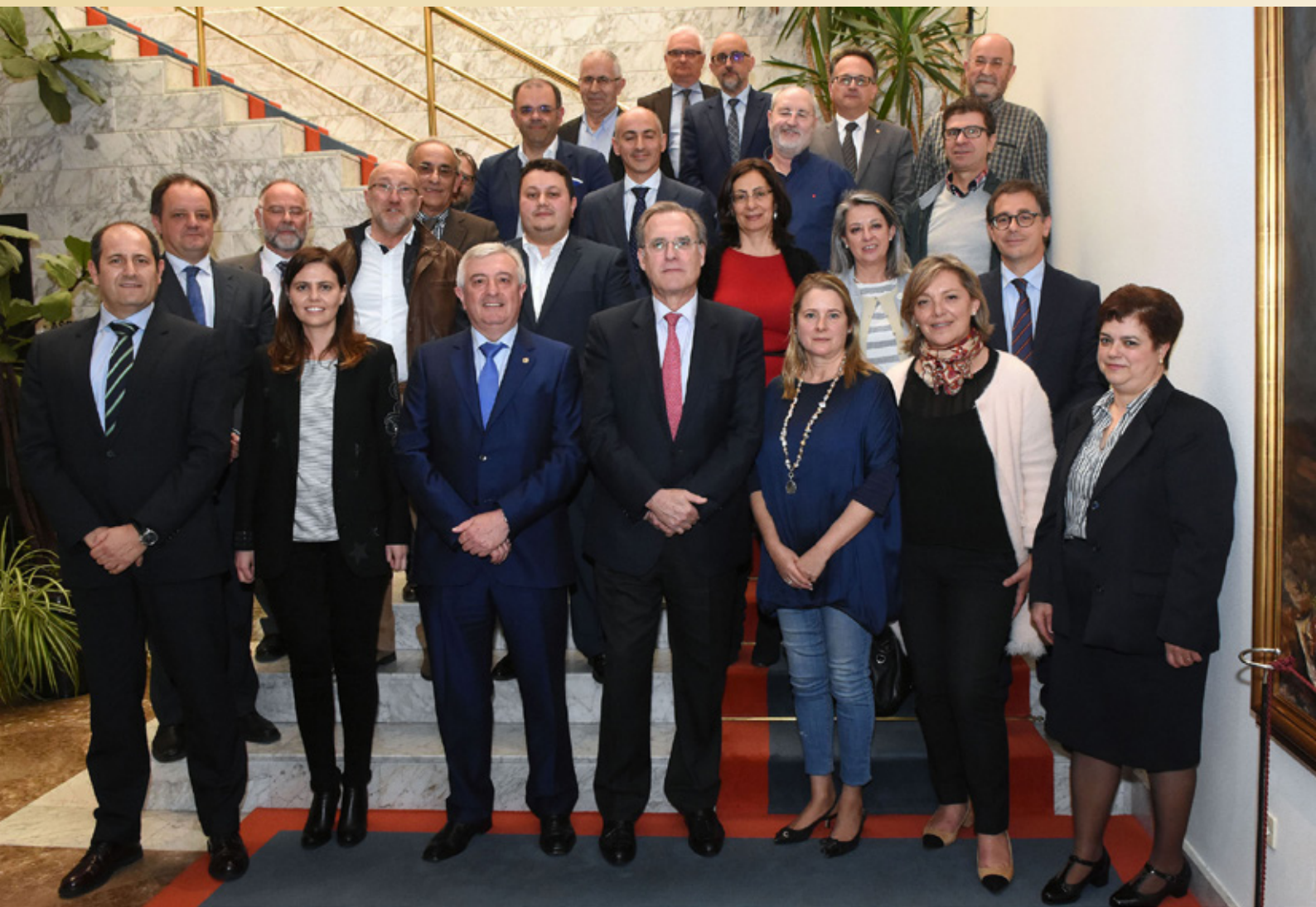
Pleno do Conselho Social