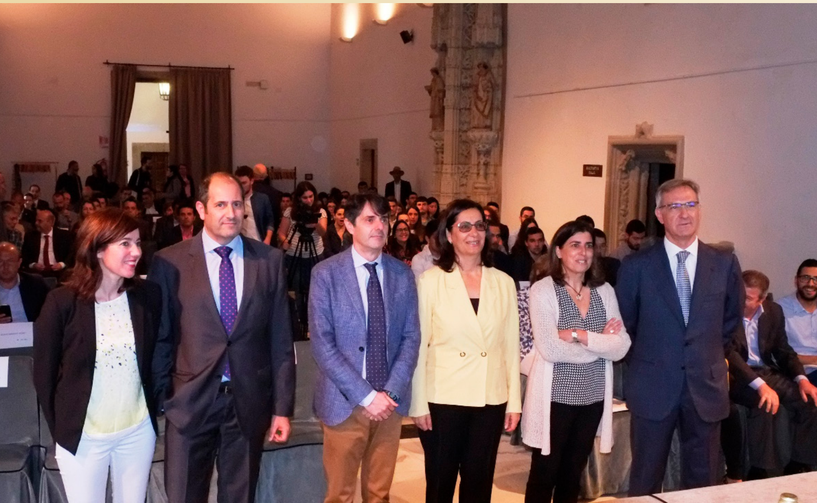
Clausura do Proxecto Mentoring