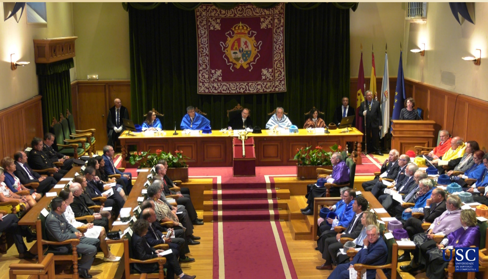
Apertura curso 2018-2019