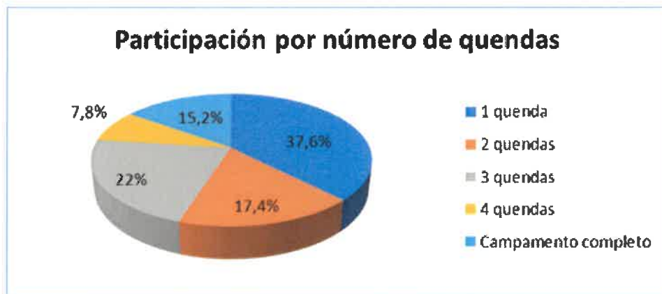
Figura 1: Porcentaxe de participación no Verán CampUSC 2021 por quenda

O número total de rapaces e rapazas inscrites foi de 218, cun total de 534 inscricións, participando nunha única quenda o 37,60%, en dúas o 17,40%, en tres quendas o 22%, o 7,80% en catro quendas e o 15,20% no campamento completo (ver Fig.1).