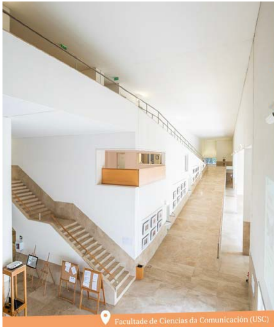
Facultade de Ciencias da Comunicación (USC)

O acto de constitución tivo lugar na Facultade de Ciencias da Comunicación o xoves 22 de xuño de 2023, ás 11:00 horas.