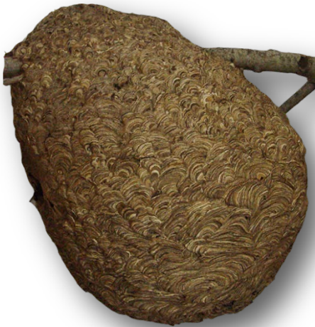
D. Victoriano Urgorri Carrasco Niño de Vespa velutina

Dous niños secundarios de Vespa crabro Un exemplar de niño primario de Vespa velutina Catro modelos de trampas de Vespa velutina Depósito temporal dun cortizo