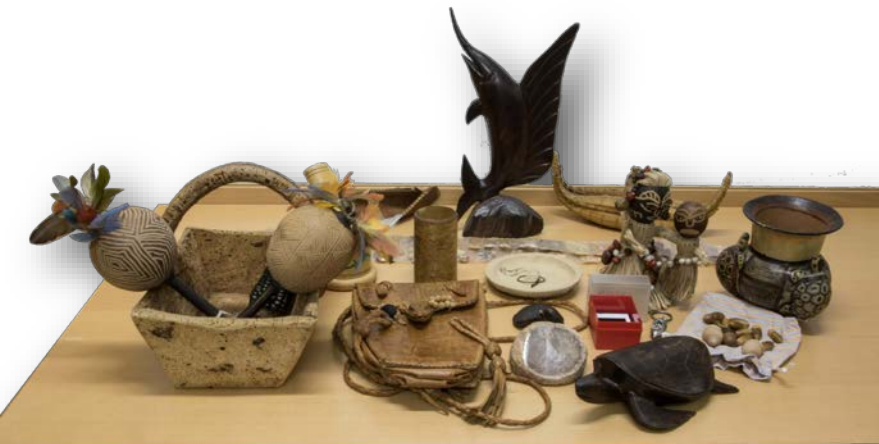
D. Jesús Izco Sevillano Colección de obxectos de natureza etnobotánica e etnozoolóxica, e dunha colección de diapositivas de Aula Aberta