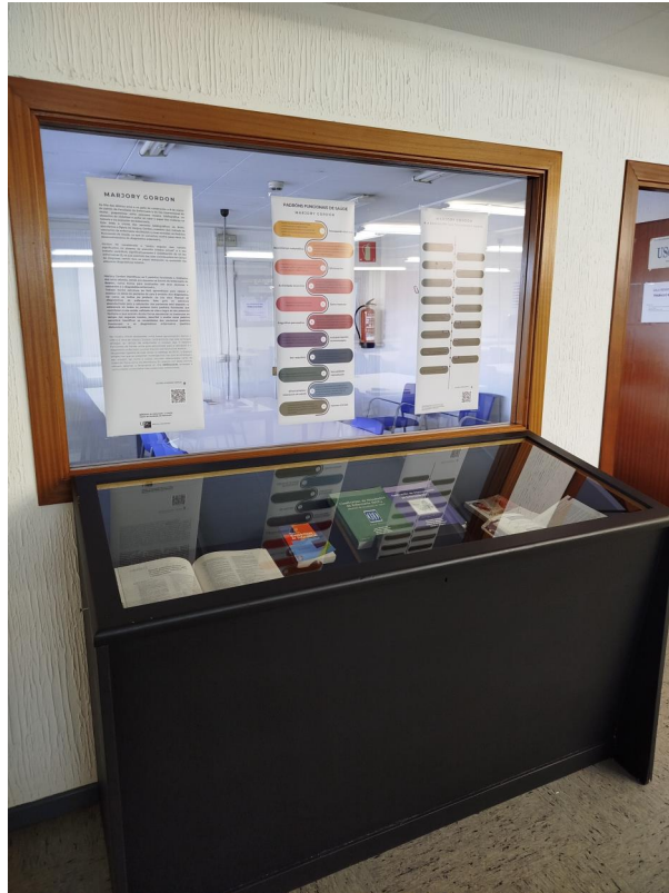
3 - Vitrina da mostra na Biblioteca de Enfermaría